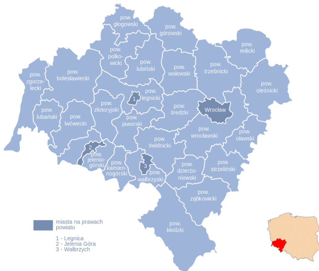
Rys. 1. Podział administracyjny województwa dolnośląskiego.

Ogólna powierzchnia geodezyjna gminy wynosi 12.225 hektarów.